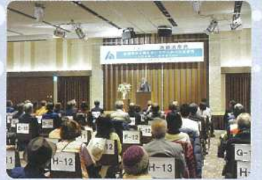
上野法人会「特別講演会」

マスコミでおなじみの著名な講師を招いて、政治、経済、経営、健康、一般教養、スポーツ、文化など、幅広い分野にわたる講演会を開催しています。地元ゆかりのある文化人など、会員の皆様に喜んでいただける多彩な講師をお迎えしています。講演会の内容・講師については、各地の法人会にお問い合わせ下さい。