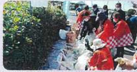
広島南法人会「清掃活動」