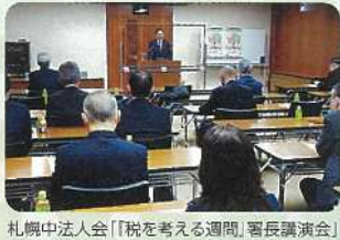
札幌中法人会「税を考える週間」

企業活動にとって税は切り離せません。そのため、法人会では、税務署の講師や税理士による税務研修会、決算法人説明会、年末調整説明会など様々な研修会を開催しています。