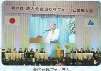
全国女性フォーラム

女性経営者から従業員までがメンバーとなっている女性部会では、「税に関する絵はがきコンクール」などの租税教育を実施する一方、福祉施設への慰問等の地域に密着した社会貢献活動や、節電を広く啓発する「いちごプロジェクト」に取り組んでいます。これらの活動紹介、部会員相互の情報共有や交流を図る目的で、毎年「全国女性フォーラム」を開催しています。