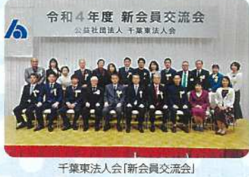
千葉県法人会「新会員交流会」

地元で活躍している企業はもとより、遠隔地にある会員企業とも交流のチャンスがあります。