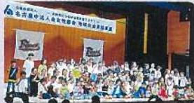
名古屋中法人会「地域社会員献事業」