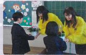
宇摩法人会「ボランティア活動」