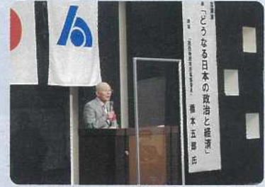
高田法人会「通常総会記念講演会」