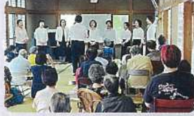
入道法人会「介護福祉ボランティア活動」