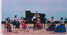
伊勢法人会「税を考える週間」