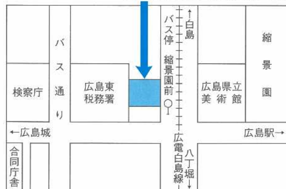
法人会事務局 (山本ビル2F)

URL : https://hojinkai.zenkokuhojinkai.or.jp/hiroshimahigashi/