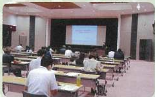
高岡法人会「雇用管理研修会」