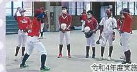
南会津法人会「青少年健全育成事業」