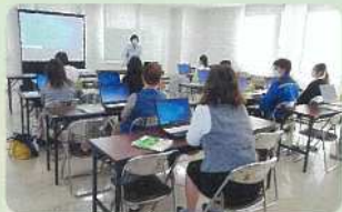
伊万里有田法人会「パソコン教室」